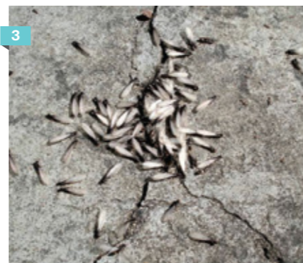
1. Colonia de termitas 2. Efecto de infestación en concreto 3. Colado en residencial "Los Encinos", Hermosillo, Sonora